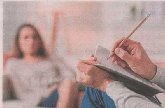
La asesoría psicológica se ofrecerá por teléfono e internet.

Por eso, las entidades de discapacidad intelectual están trabajando unidas para superar mejor las dificultades.