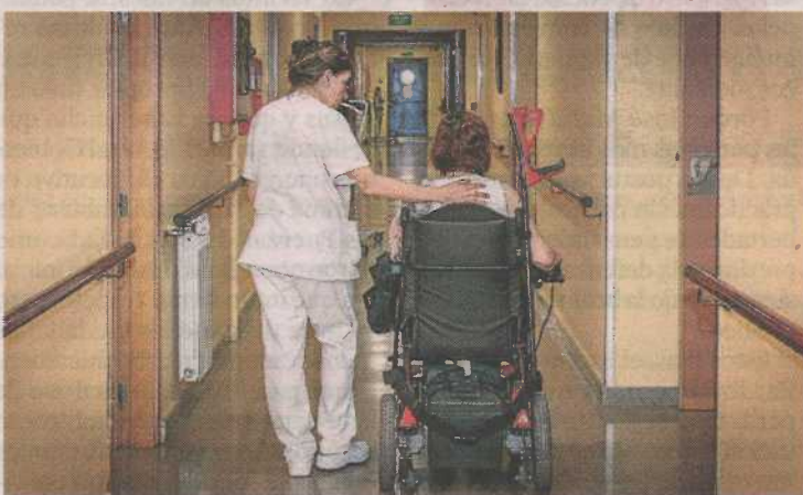
Centro residencial de DFA.

Fundación DFA cuenta con tres centros residenciales. Cada uno de ellos ha tenido que adaptar sus condiciones a las medidas del confinamiento. Cada espacio, cada sala, cada rincón ha tenido que reinventarse para poder continuar con la vida diaria, dentro de las posibilidades. Se han establecido tur-