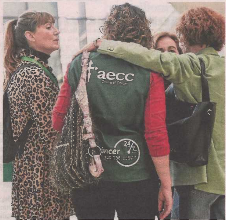
Voluntarias, en el congreso celebrado en 2019.

Además, teniendo en cuenta la situación de emergencia social, ha creado un fondo de ayuda económica destinado a pacientes en situación de vulnerabilidad, que dotará inicialmente con 3 millones de euros para toda España. En este sentido, la organización hace un llamamiento a los ciudadanos y empresas para que aporten donaciones y hacer crecer el fondo lo máximo posible. «Esta partida económica –señala García– se ha puesto al servicio de las personas que más lo necesitan con el objetivo de estar más cerca de